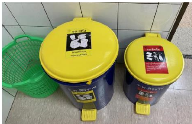
ภาพที่ 6 ขยะไม่มีรังสีแยกเป็นขยะทั่วไปใส่ถุงสีเหลือง และขยะติดเชื้อใส่ถุงสีส้ม