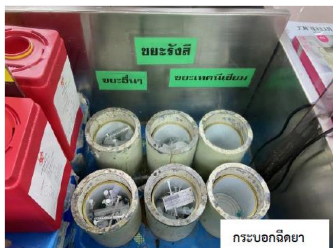
ภาพที่ 7 ภาชนะแยกกากกัมมันตรังสีตามประเภทของกากกัมมันตรังสี