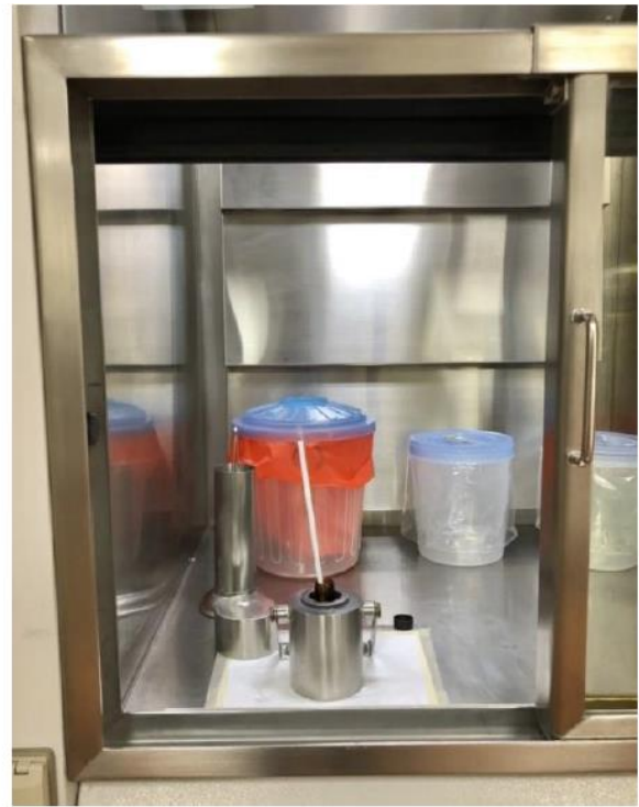
ภาพที่ 3 ตู้ดูดควันสำหรับบริหารสารเภสัชรังสี ชนิดมีคาร์บอนฟิลเตอร์ ตามมาตรฐานห้องปฏิบัติการทางรังสี