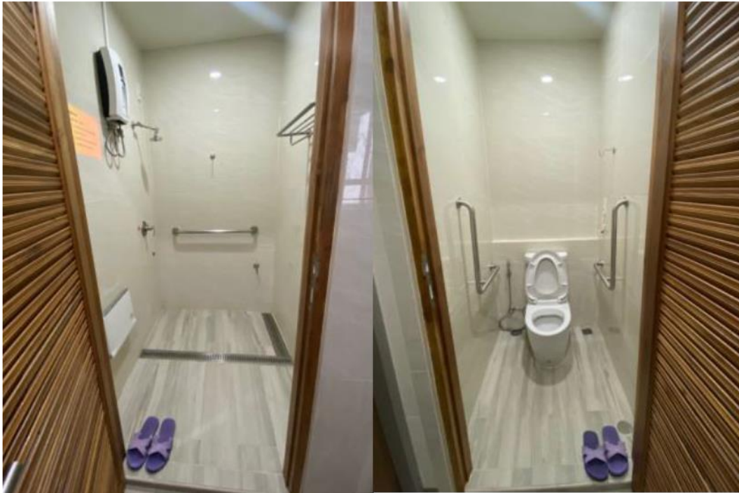
ภาพที่ 5 ห้องน้ำผู้ป่วย